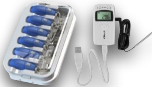
TEMPERATURE AND HUMIDITY DATA LOGGER