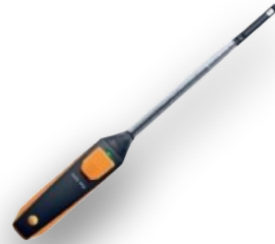
ANEMOMETER (VELOCITY METER)