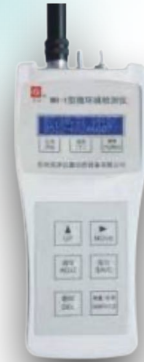
MICRO ENVIRONMENTAL DETECTOR