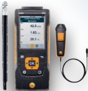
ANEMOMETER (VELOCITY METER)