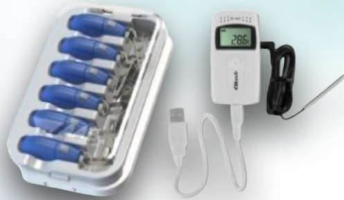
TEMPERATURE AND HUMIDITY DATA LOGGER