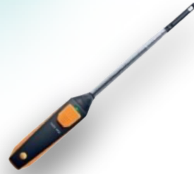
ANEMOMETER (VELOCITY METER)