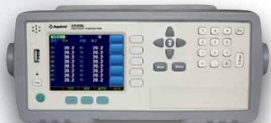
16 CHANNEL DATA LOGGER