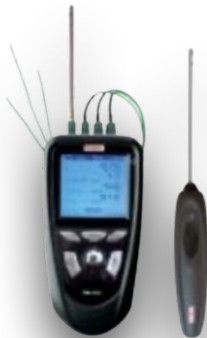
4 CHANNEL DATA LOGGER